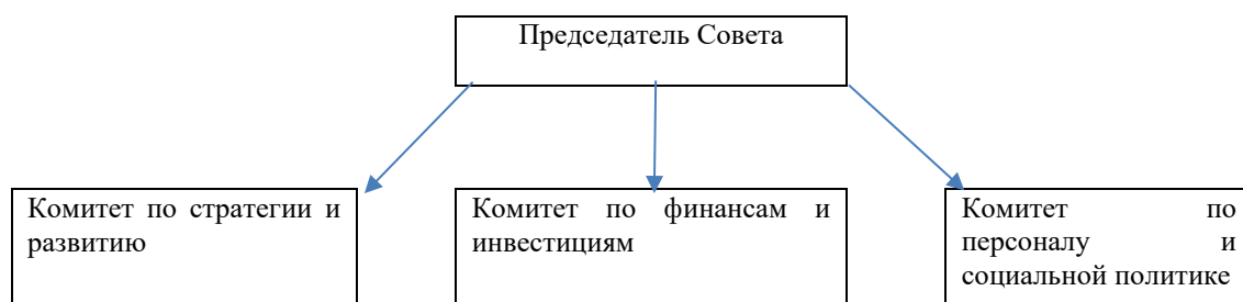
Структура и состав Управленческо-консультативного совета